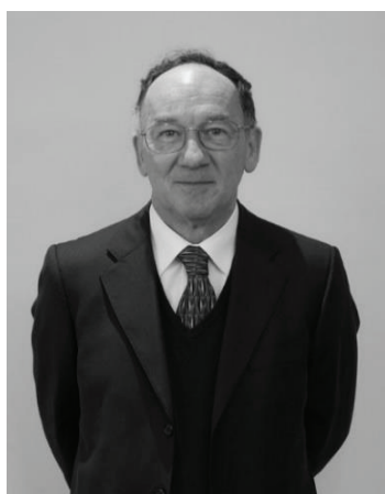
QUÉBEC, CANADA INDÉPENDANT (1) ADMINISTRATEUR DEPUIS 2010