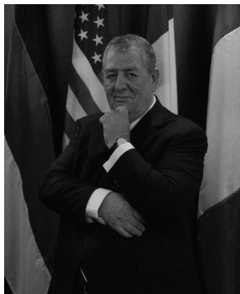
CANTON DE GENÈVE, SUISSE NON-INDÉPENDANT ADMINISTRATEUR DEPUIS 2013