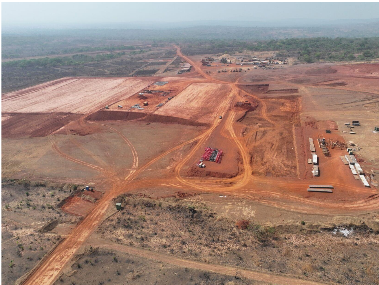
Illustration 1 – Site de Kiniero