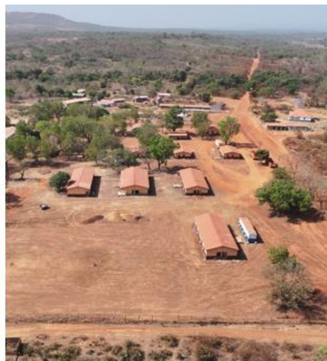
Illustration 3 – Camps de l’encadrement et des travailleurs