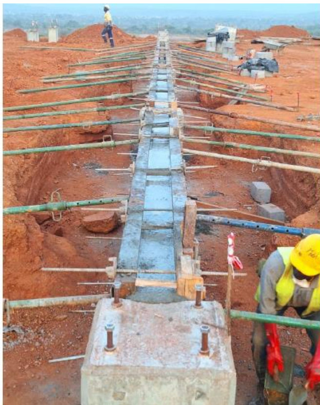
Illustration 2 – Coulée des fondations de l’atelier de production à Kiniero